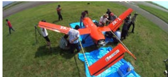
図 3. 当研究室の SAR 地上実証実験用の大型無人航空機(UAV)